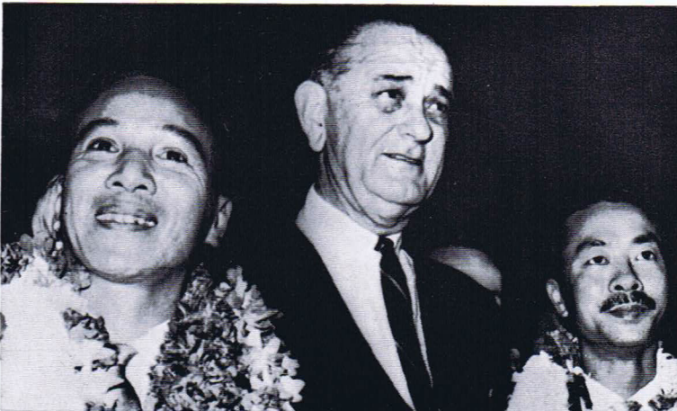
Lyndon B. Johnson in Honolulu mit dem Staatsoberhaupt von Südvietnam van Thieu (links) und Ministerpräsident Ky (rechts) (zu: Johnsons Friedensfühler und Moskaus Antwort, S. 119)